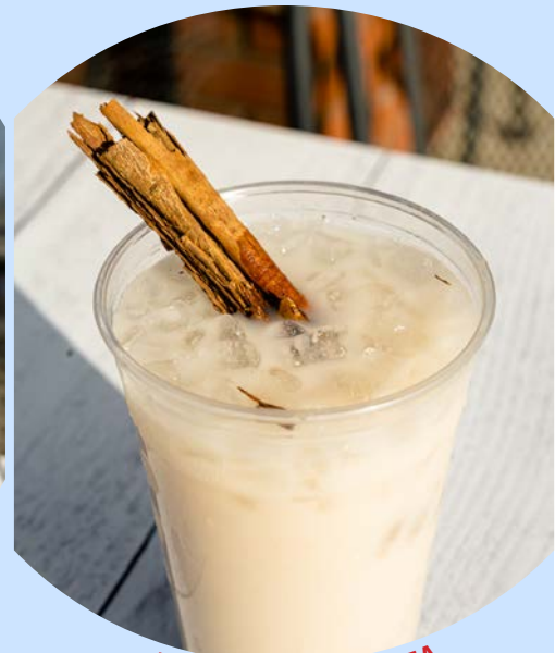
AGUA DE HORCHATA