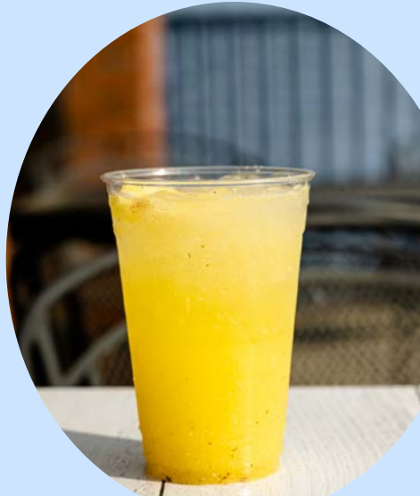
AGUA DE MANGO

Waters prepared with natural fruits Lemon • Strawberry • Pineapple, Melon • Horchata • Coconut Rompope • Mixed Fruits